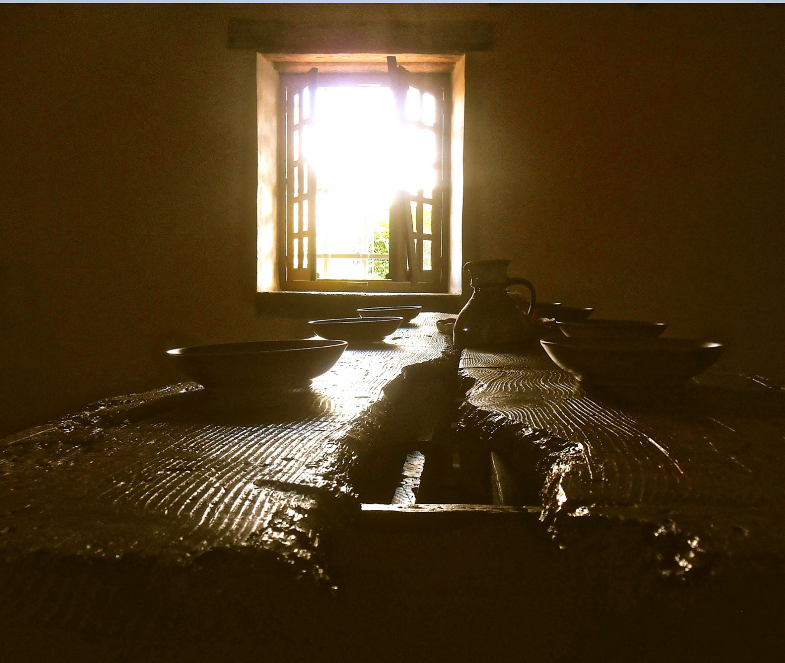
Mesa de La Valla - Primeira comunidade marista