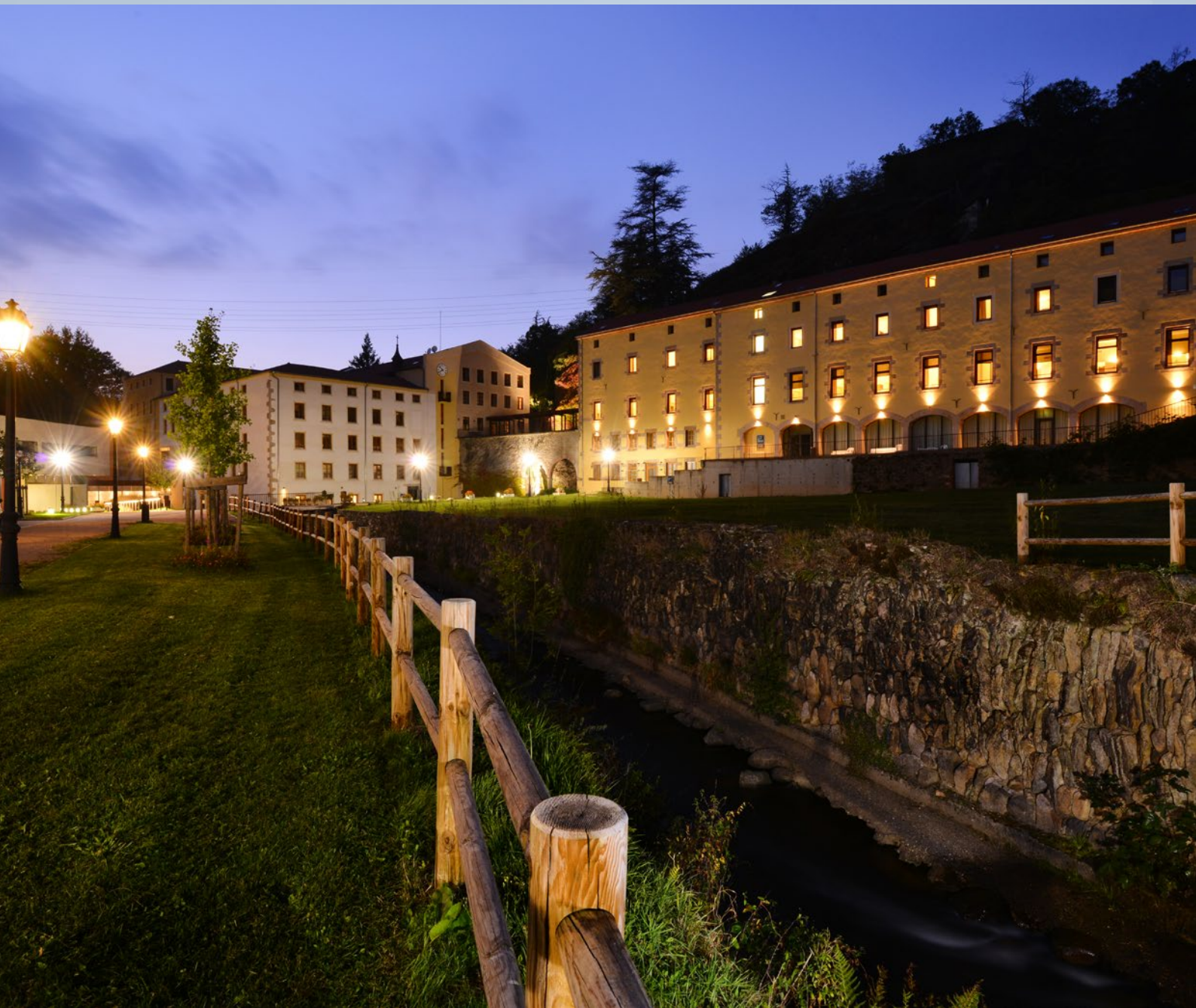
Notre-Dame de l'Hermitage