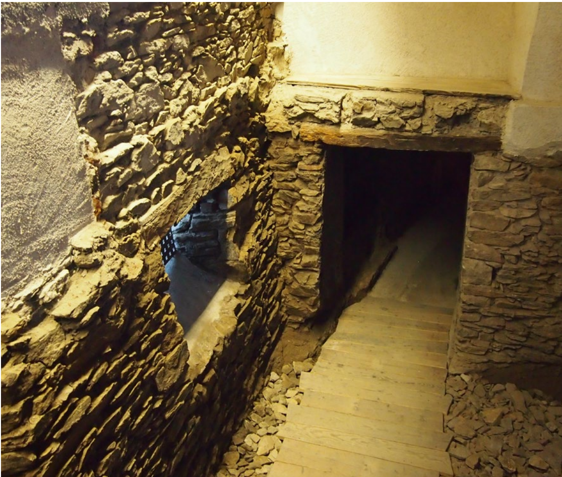
La Valla – Ingresso ao subsolo da casa

É no silêncio onde descobrimos melhor o fogo que nos habita, essa luz interior com a qual nos sentimos em casa. Quando experimentamos esta luz, os medos vão desaparecendo. A partir do silêncio orante somos capazes de experimentar, de maneira próxima, a presença de Deus que habita nosso coração.