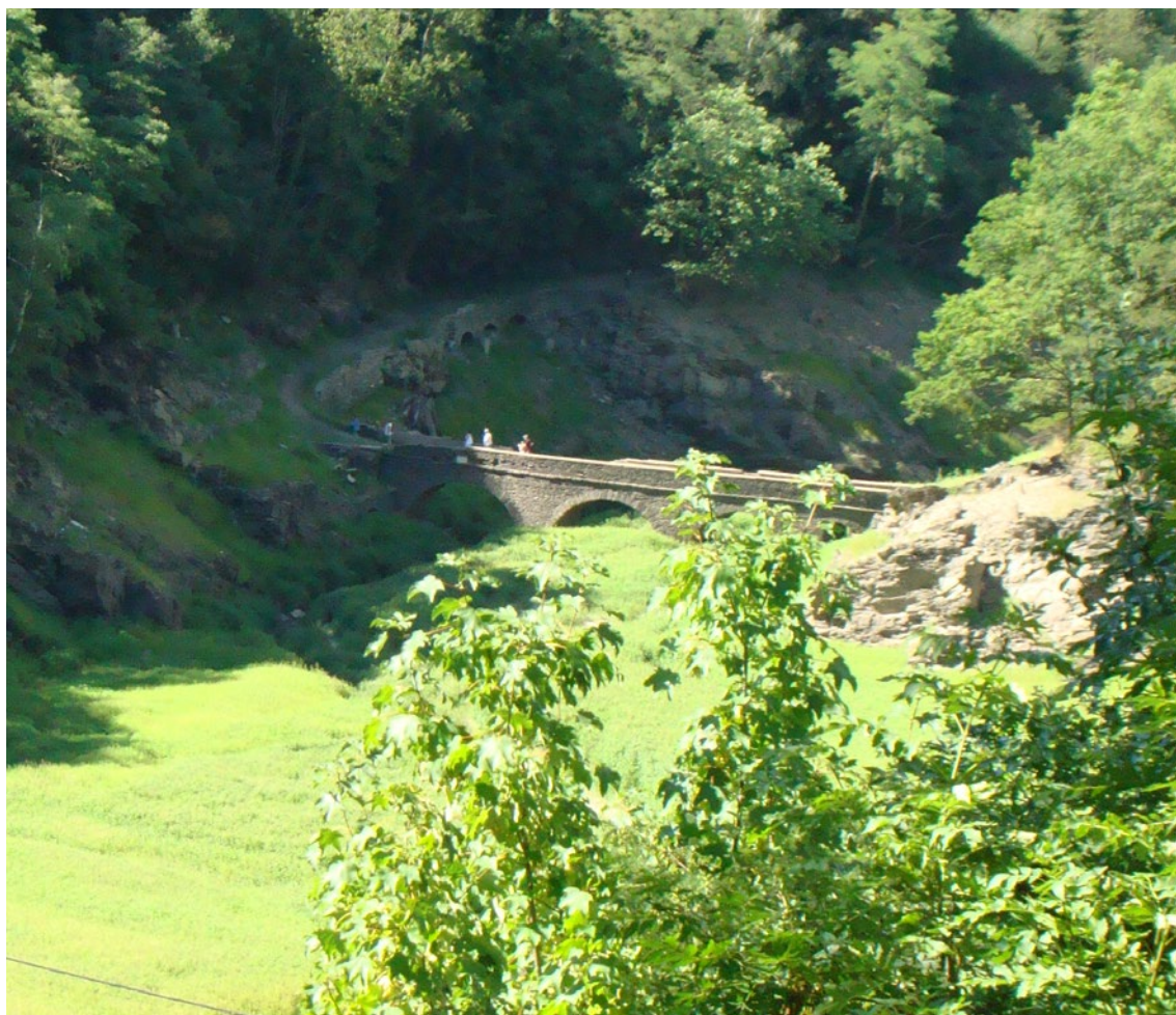
La Valla – Ponte onde Champagnat se encontra com João Maria Granjon, primeiro Irmão Marista (foto de 2013, quando foi esvaziada a represa).

sessenta e, desde então, termo-nos visto diminuir e envelhecer paulatinamente. Sabemos que esta experiência tem sido em parte resultado de uma revolução eclesial e social na qual entramos, todo mundo, e todas as vocações de especial consagração na Igreja. Como parte dessa revolução, temos também a grata experiência de um laicato cristão e um laicato marista que foi surgindo, cada vez com mais força, como um grande dom para o Instituto e para a Igreja.