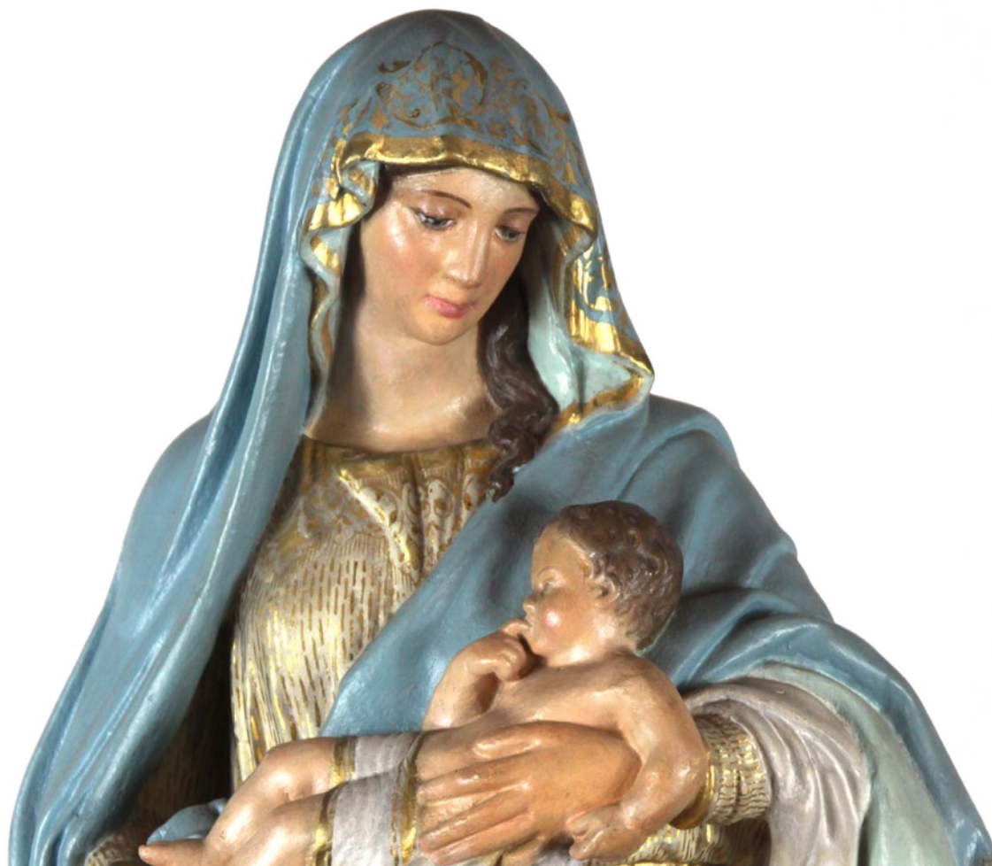
Estátua da Boa Mãe, diante da qual rezava o Pe. Champagnat

dos, porém, querendo que a luz da esperança não se apague. Isso é que queremos: que a luz da esperança não se apague...” 2