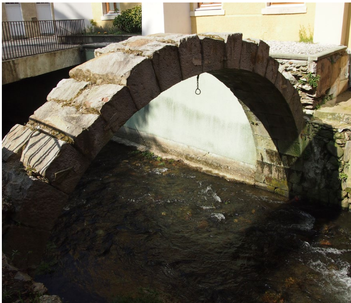
Rio Gier - Notre-Dame de l'Hermitage

cristãos, suscitamos nos jovens o desejo de comprometer-se a seguir a Cristo. Isto dizem as Constituições (C 82) e eu estou convencido disso. A vida atrai. Sobretudo a de um grupo, a de uma comunidade; é muito mais convincente que a de um só indivíduo”. 50