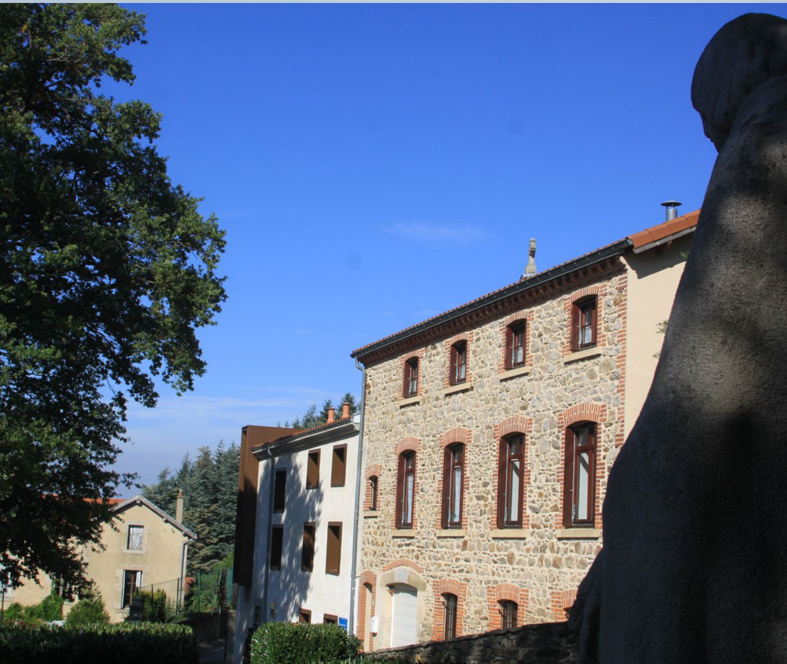
Casa de La Valla, vista da estátua de Champagnat