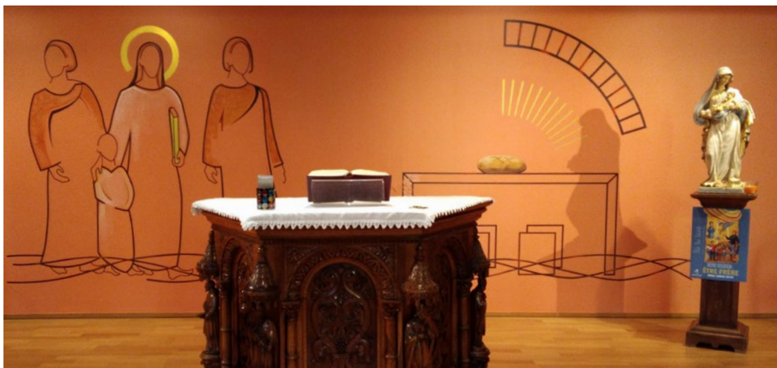
Oratório da comunidade em Notre-Dame de l'Hermitage

ce mos ao partir juntos o pão, ao formar sinergia a partir dele, ao atrever-nos a dar-nos como Jesus, “partindo-nos” para o bem dos demais, para o bem da vida de cada jovem... E é então quando reconhecemos que arde nosso coração de paixão por Deus e pela humanidade, como o de Marcelino e o de Maria. Necessitamos que este coração ardente reavive a luz em nossos lares.